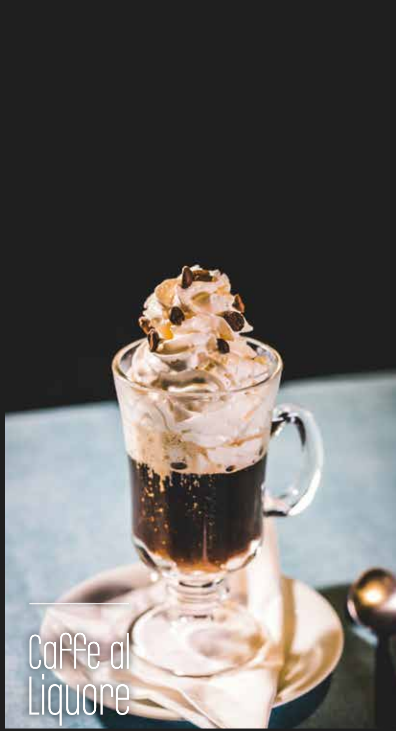
Caffè al Liquore