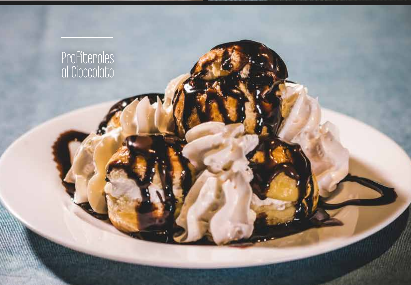
Profiteroles al Cioccolato